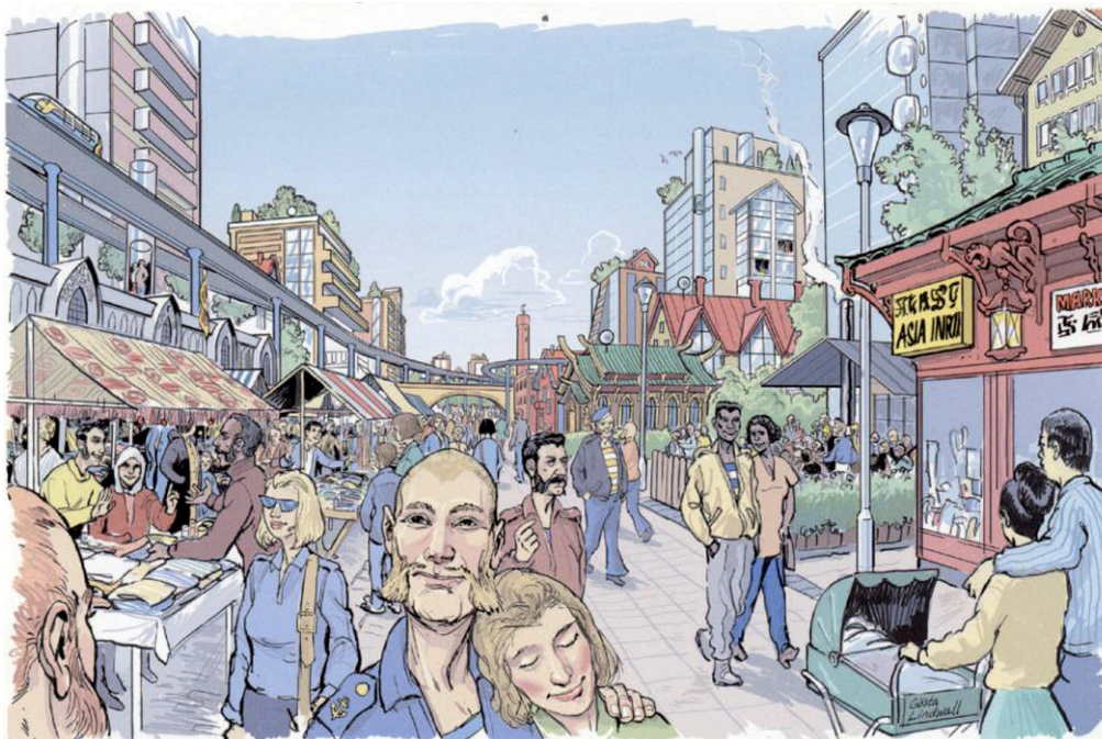
SPÅRBILAR FÖR EN HÅLLBAR STAD; KLIMAT- OCH MILJÖVÄNLIG, BULLERFRI OCH SÄKER.

KOMmuner som Prövar Att Satsa på Spårbilar www.podcar.org/kompass e-post: infokompass@podcar.org Tel: 070-530 41 64